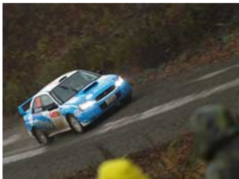
No.76 高橋・中村