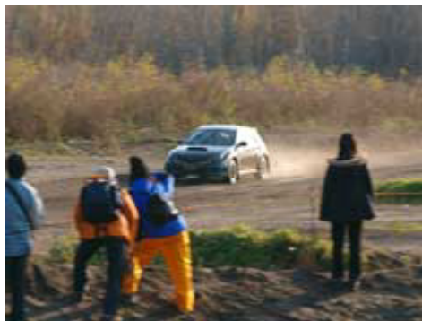
No.63 北村・竹下