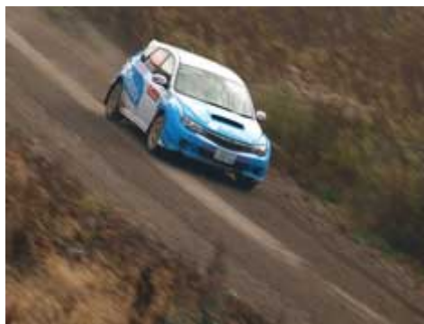
No.63 北村・竹下