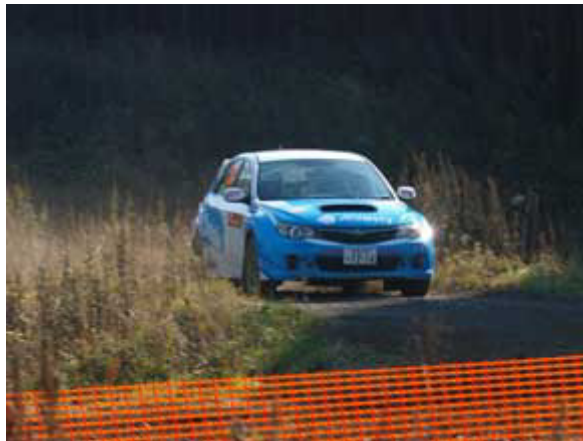
No.63 北村・竹下