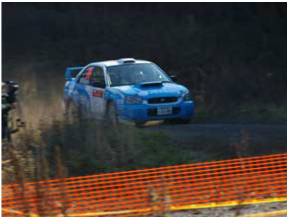
No.76 高橋・中村